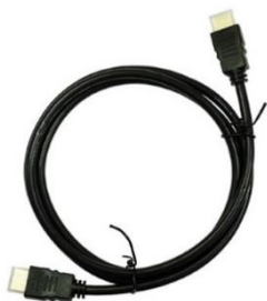
モニター用接続ケーブル